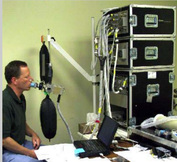
L'astronaute David Brown, lors d'un entraînement sur l'ARMS-II